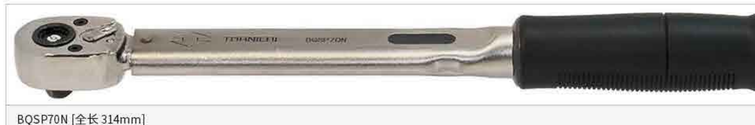
BQSP70N [全长 314mm]