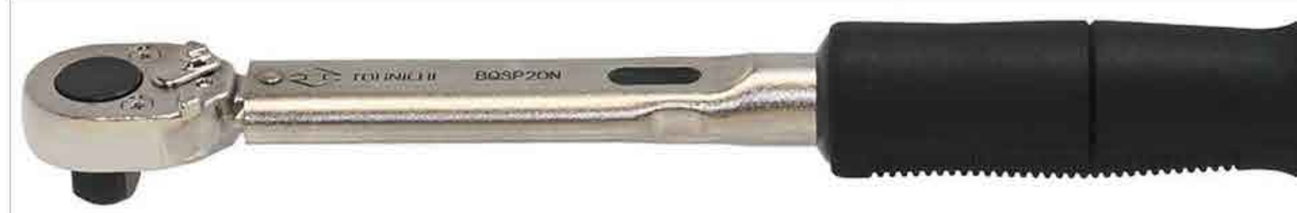
BQSP20N [全长 213.5mm]